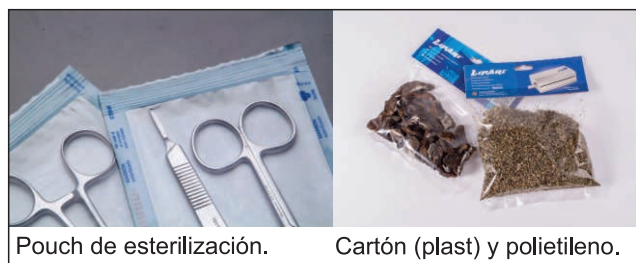
Pouch de esterilización.